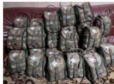
30 IFAK kits