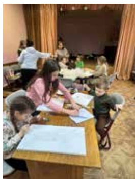
Betreuung im Klub