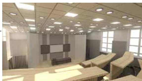
Staatliche Technische Universität: Hörsaal Baustelle und Fertigstellung